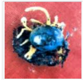
Sibine sp. infectada por hongo

Las familias mejor conocidas en palma aceitera son Elasmidae ( Elasmus spp.), Eulophidae ( Elachertus , Euplectromorpha , Kaleva , Nesolynx ), Eurytomidae ( Eurytoma ) y Pteromalidae ( Halticopteroides ) (Cuadro 1). Las especies de Eulophidae son las mejor representadas y son parasitoides de ninfas de H. subfaciata y de larvas de varios lepidópteros.