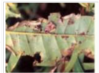
Una ninfa de Mormidiasp. atacando un adulto de Stenoma cecropia