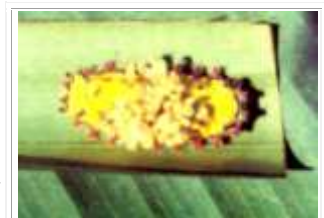
Pupas de Cotesia sp. sobre una larva de Sibine sp.