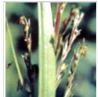
S. melaleuca siendo visitada por numerosos cálcidos ( Conura sp)

Las especies de Cotesia son endoparásitos comunes de larvas de Limacodidae ( Sibine spp, Euclea diversa y E. eleasa ), Attacidae ( Dirphia gregatus Cramer) y O. kirbyi (Cuadro 3). La larva al final de su desarrollo emerge a través del tegumento del huésped y teje un pupario blanco cilíndrico sobre la oruga moribunda en el caso de Limacodidae; o dentro del estuche en Psychidae (Desmier de Chenon 1989). En Sibine fusca , la avispidas parasita larvas de octavo a décimo estado de desarrollo. En el momento de la emergencia se han observado de 100 a 250 individuos por larva huésped. El ciclo de vida ocurre en 10-12 días, y el nivel de parasitismo ha sido de 30-35% (Genty 1984).