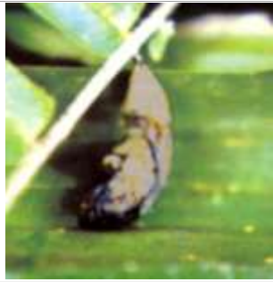
Pupa de Opsiphanes sp parasitada por larvas taquínidas

En Costa Rica, Trichospilus diatrae (Eulophinae), se encontró parasitando pupas de S. cecropia y Peleopoda sp., entre 40% y 80% respectivamente; más de 240 avispidas emergieron de un pupario de S. cecropia , y entre 40 a 60 en uno de Peleopoda sp (Mexzón y